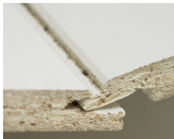
Not, fjær og fas