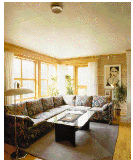
Arbor ferdigmalt himlingsplate